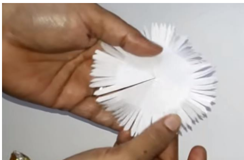
Na poljubnem mestu 1x zarežemo do sredine.