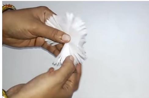
List zvijamo v stožec (pomagamo si z ovijanjem okoli prsta).