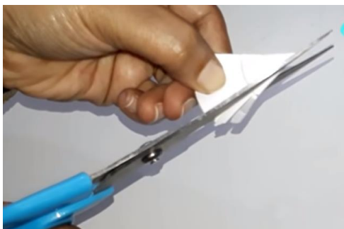
Narežemo cvetne liste (režemo do črte).