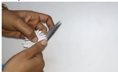
Cvetne liste na rahlo razpnemo (pomagamo si s svinčnikom, škarjami ali palčko).