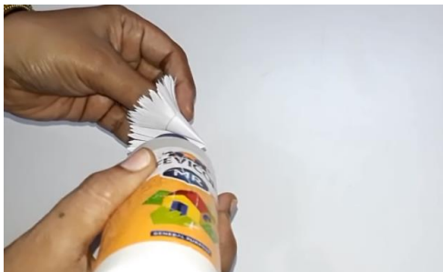
Konec utrdimo z lepilom. Dobimo cvet.