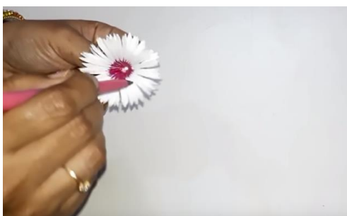
Notranjost cveta pobarvamo s flomastrom. Izberemo močne (izrazite) barve. Črte vlečemo iz središča navzven.