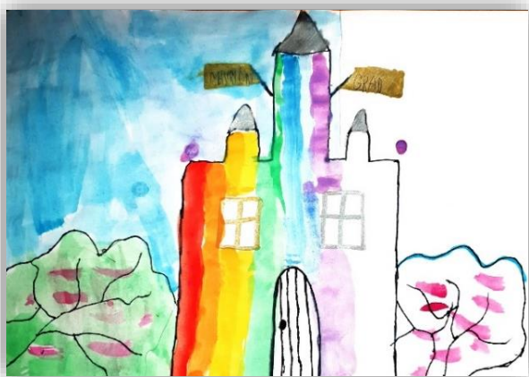
Anže Vnučec Sampl, 4. a