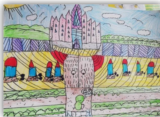
Tjaša Medvešek, 4. a