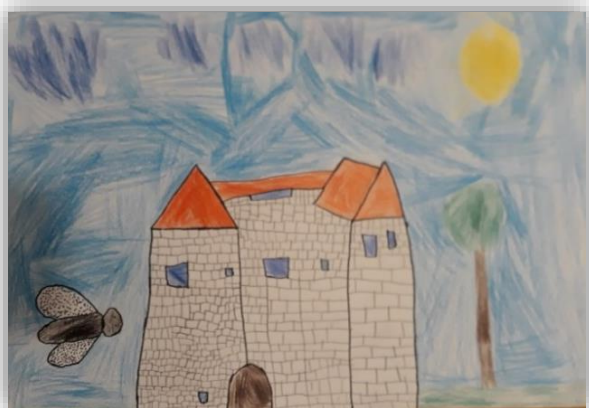
Erazem Bucik, 4. a