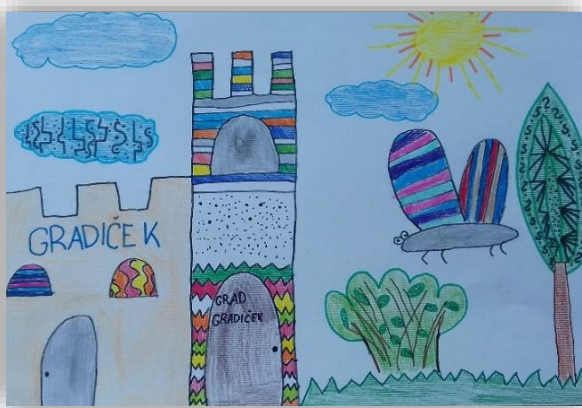
Julija Škodnik, 4. a