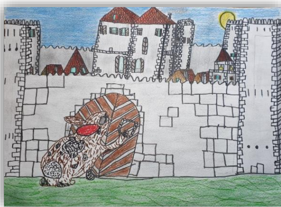
Ian Murovec Hvalica, 4. a