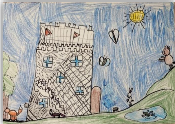
Amadeja Bole, 4. a