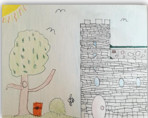
Jaka Gabrijelčič, 4. a