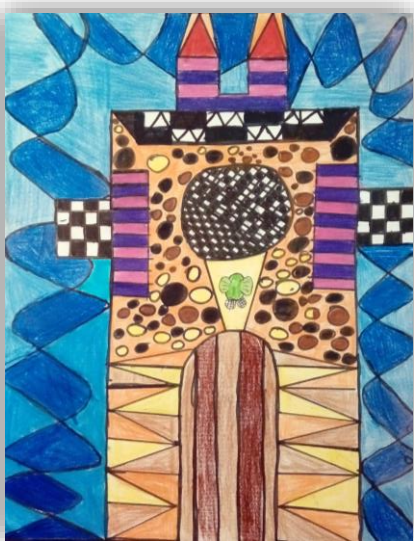
Jernej Škvarč, 4. a