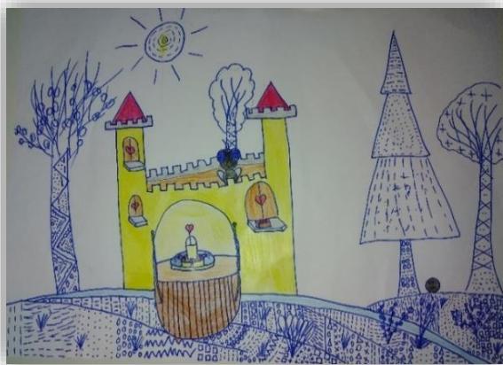
Lana Žnidarčič, 4. a