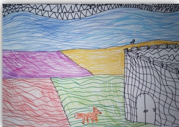
Nace Strnad, 4. a