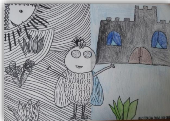
Anej Petrevčič, 4. a